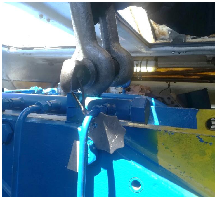
Placa identificativa del grillete enganchada en uno de los latiguillos de la multiplicadora

El gruísta se encontraba realizando la maniobra de aproximación de los útiles de izado, pulpo de cuatro ramales con cuatro grilletes, para su posterior colocación por parte de los técnicos en las orejetas de la multiplicadora. Durante dicha maniobra una anilla colocada para sujetar la placa identificativa de uno de los grilletes se engancha con la estructura de la multiplicadora, en concreto con un latiguillo.